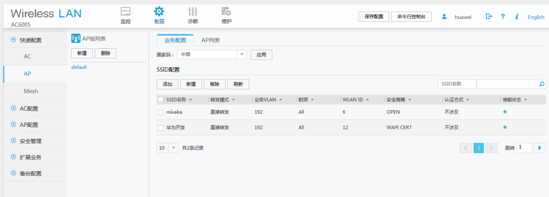
图 3. WEB网管配置界面

以AP组为中心，常用参数默认选中，无需预先配置，简化配置步骤；针对业务差异小的配置，支持参数复制功能，仅需修改差异配置，提高配置效率。